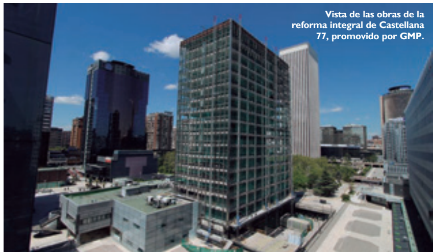
Vista de las obras de la reforma integral de Castellana 77, promovido por GMP.

También hemos comenzado recientemente el proyecto de remodelación del edificio de Serrano 90 para el gestor de fondos inmobiliarios alemán Triuva, sobre el que se va a realizar una importante actuación de renovación, incluyendo el cambio de fachada. Otro proyecto de reposicionamiento de un edificio emblemático es la reforma de la sede corporativa del BBVA en la Gran Vía de Bilbao, cuyas obras en las cinco primeras plantas de uso comercial hemos comenzado recientemente;