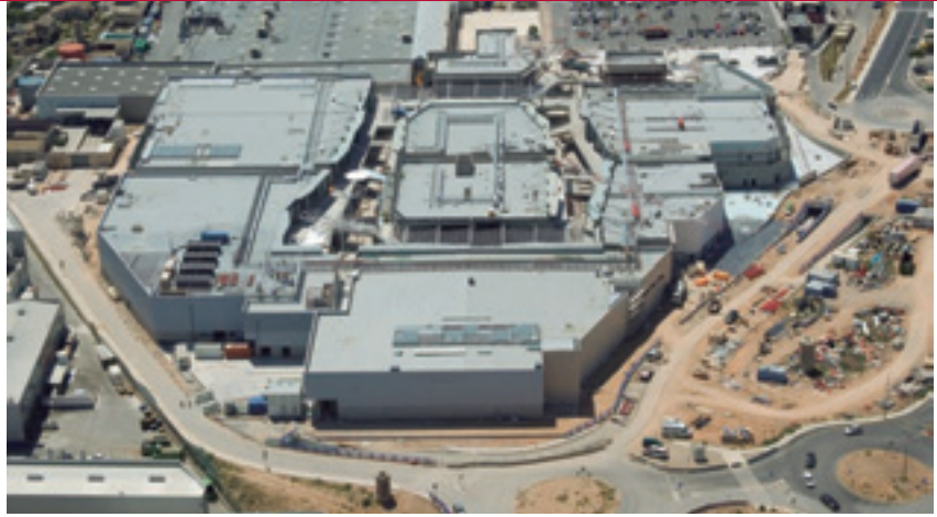
Vista de las obras del centro comercial FAN Mallorca Shopping, de Carrefour Property.

producción de medicamentos de animales para Merck Sharp & Dhome en Salamanca, en la que prestamos nuestros servicios de EPCM bajo el modelo de Precio Máximo Garantizado de construcción, y en la que asumimos por tanto como contratistas el riesgo de coste y plazo de la obra con un sistema de libros abiertos y compartición de ahorros con el cliente.